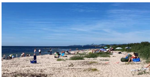
Efter tångrensning blir Lerbergets badstrand extra inbjudande. Då dyker soldyrkare, badgäster och barnfamiljer upp på soliga sommark dagar