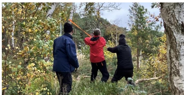
Trädfällning i Strandskogen. Med gemensamma krafter kom björkträden ned.