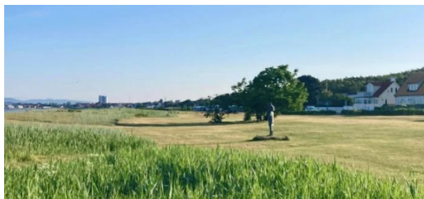
Den nyklippta Strandängen. I förgrunden statyn "Pappa kom hem" (Jonas Högström). Totalt hanterar vi ca. 12000 kvm fri gräsyta. Mellan Skogsbrynsvägen och Per Jacobs väg sparas en avgränsad gräsyta som anspråkslös blomsteräng