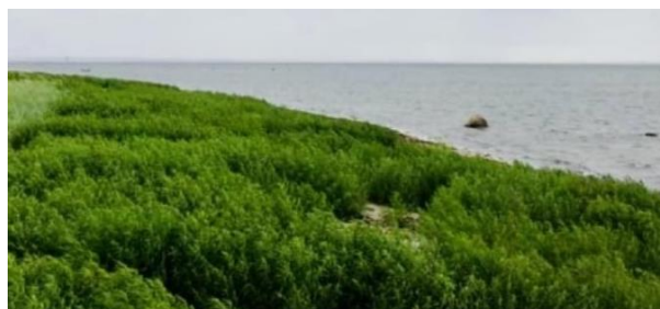
På strandområdet nedanför Lerbergets Camping fanns det ett stort parti (1500 kvm) med spontant växande strandmällor. Inte mycket till badstrand. Mällorna röjs bort manuellt och begravs vid strandvallen