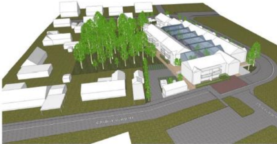
Allt med "Hus längs gatorna med orangiegård" - Vy från sydöst