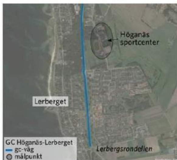
Figur 9 Ny gång- och cykelväg mellan Lerberget och Höganäs.

Åtgärdsvalsstudie Väg 111 i nordvästra Skåne Trafikverket Diarienummer 2017/102218 sid 18(23)