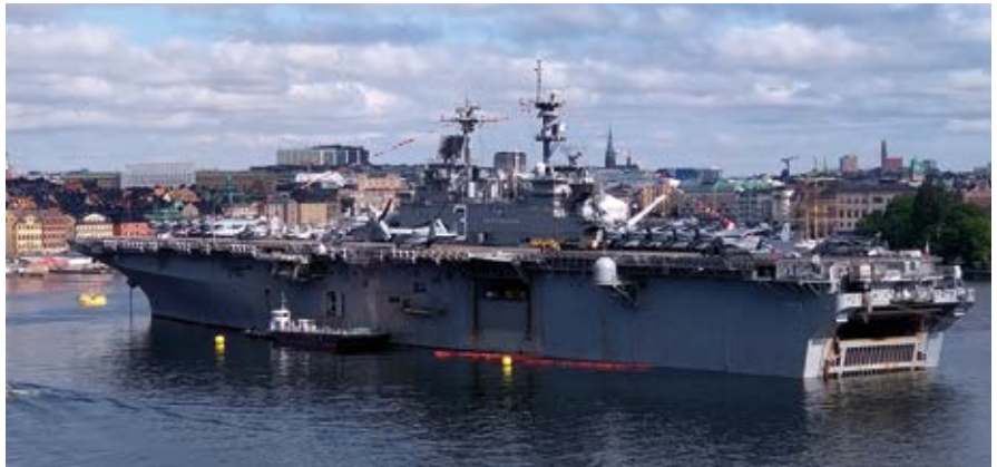
Det 257 meter långa amerikanska amfibiestridsfartyget USS Kearsarge tog rejäl plats på Stockholms ström när den svenska marinen fyllde 500 år.

Flottan byggdes snabbt ut och spelade en stor roll vid framväxten av stormakten Sverige under 1600-talet. Mängder av människor och materiel behövde skeppas över Östersjön till och från kontinenten, och fraktfartygen måste försvaras. För att kunna bemanna både