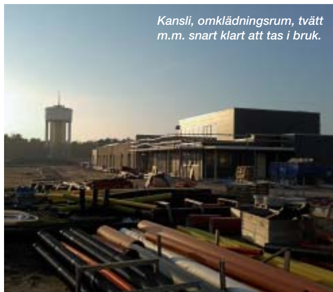
Kansli, omklädningsrum, tvätt m.m. snart klart att tas i bruk.