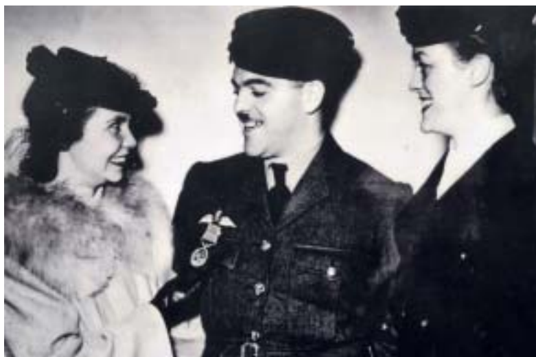
George med medalj, omgiven av fru och syster

I England vid debriefing blev han tillsagd, att om någon frågade honom hur han lyckats komma från Sverige till England skulle han svara att det var vinter så han åkte skridsko på isen över Nordsjön. Han propsade på att åter få flyga, men man ansåg inte att han skulle sändas i strid igen utan han skickades hem till Kanada och flög i stället transportplan mellan Kanada och Gibraltar tills kriget var slut.