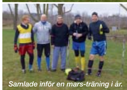
Samlade inför en mars-träning i år.