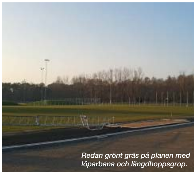
Redan grönt gräs på planen med löparbana och längdhoppsgrop.