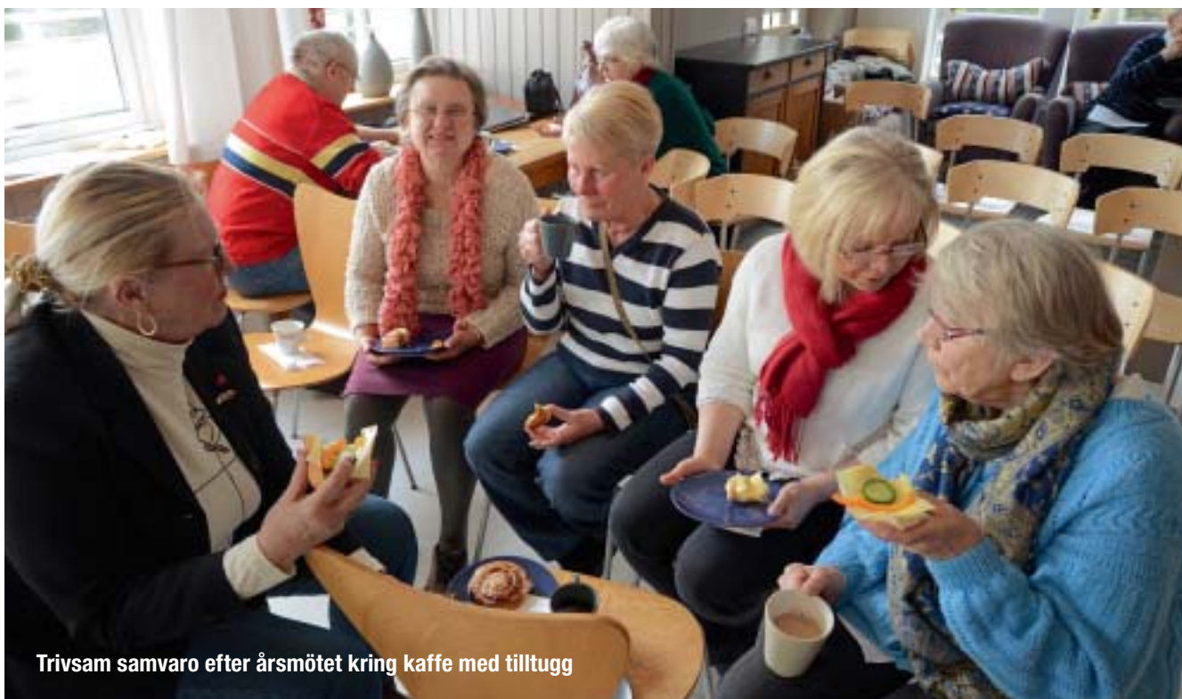
Trivsamt samvaro efter årsmötet kring kaffe med tillugg