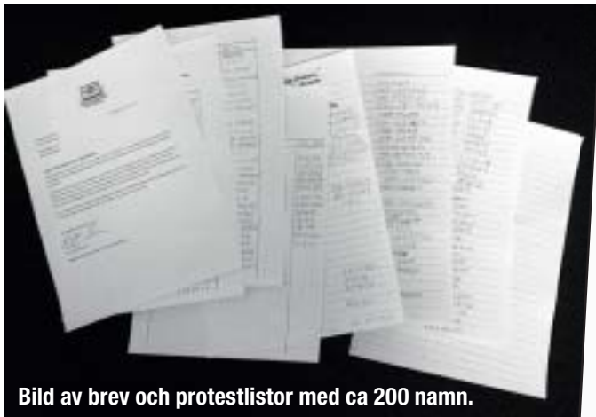
Bild av brev och protestlistor med ca 200 namn.

En händelse som för de flesta har gått spårlöst förbi men som för vissa blivit en dramatisk förändring av tillvaron. Vi hoppas att beslutet omprövas med det snaraste. Byaföreningens styrelse har skickat en skrivelse till Höganäs kommun.