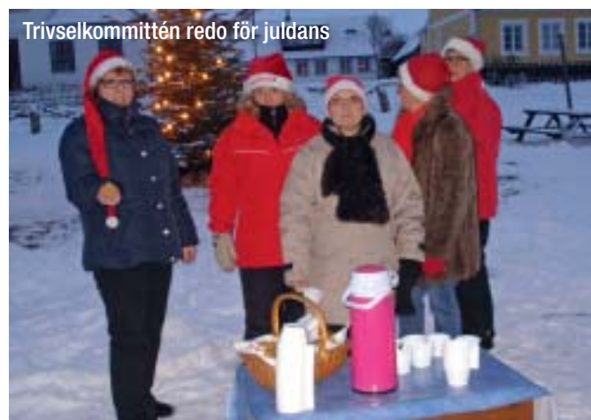
Trivselkommittén redo för juldans