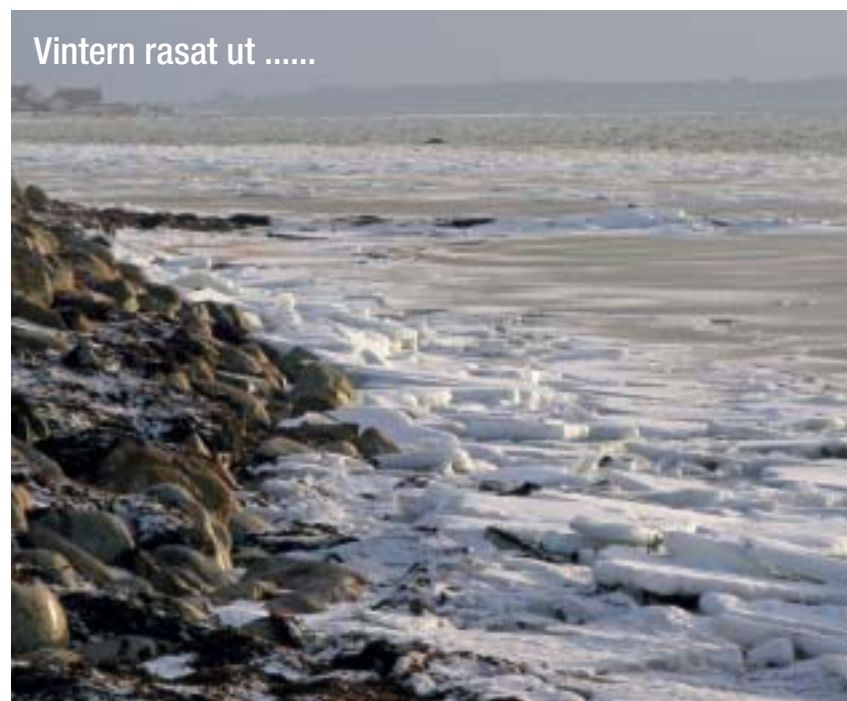
Vintern rasat ut .....