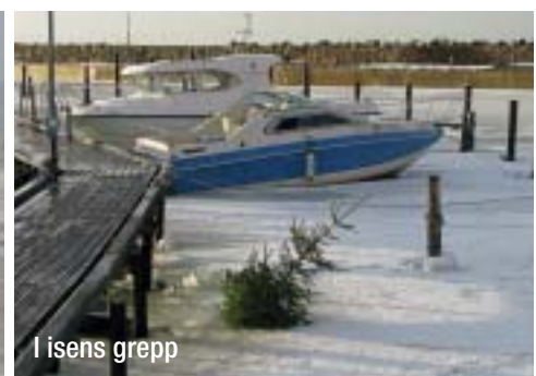
I isens grepp