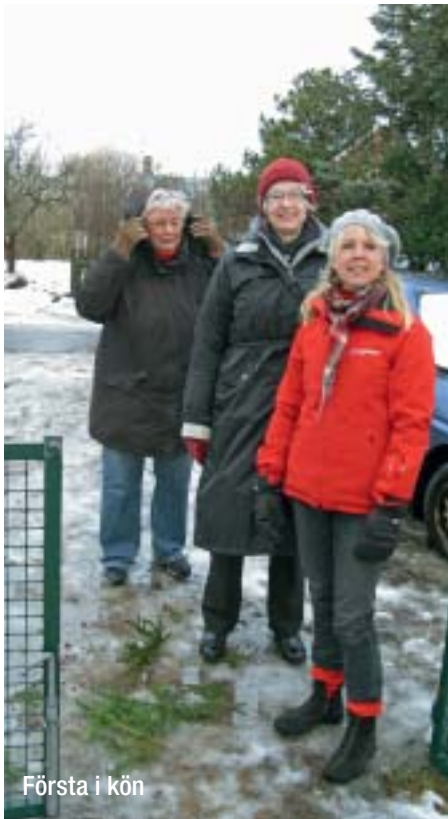
Första i kön