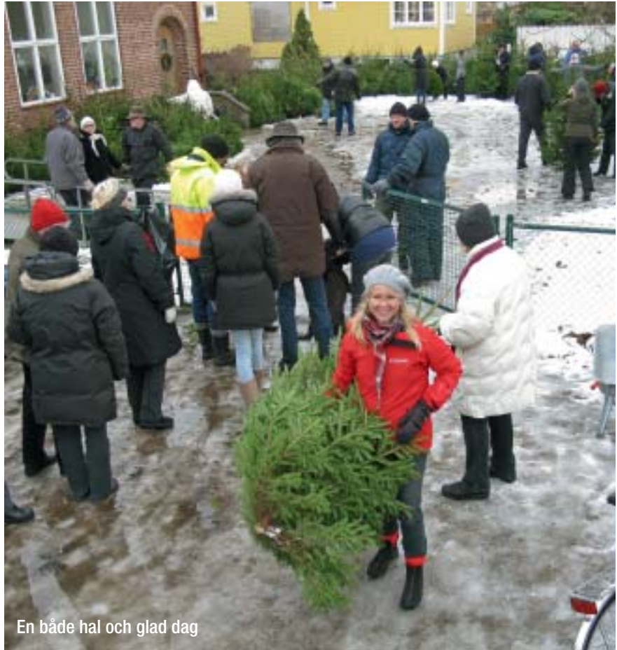
En både hal och glad dag