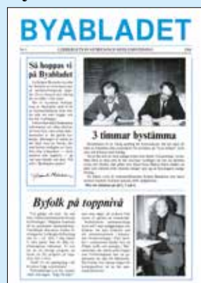
Byabladets 3 första nummer 1986.