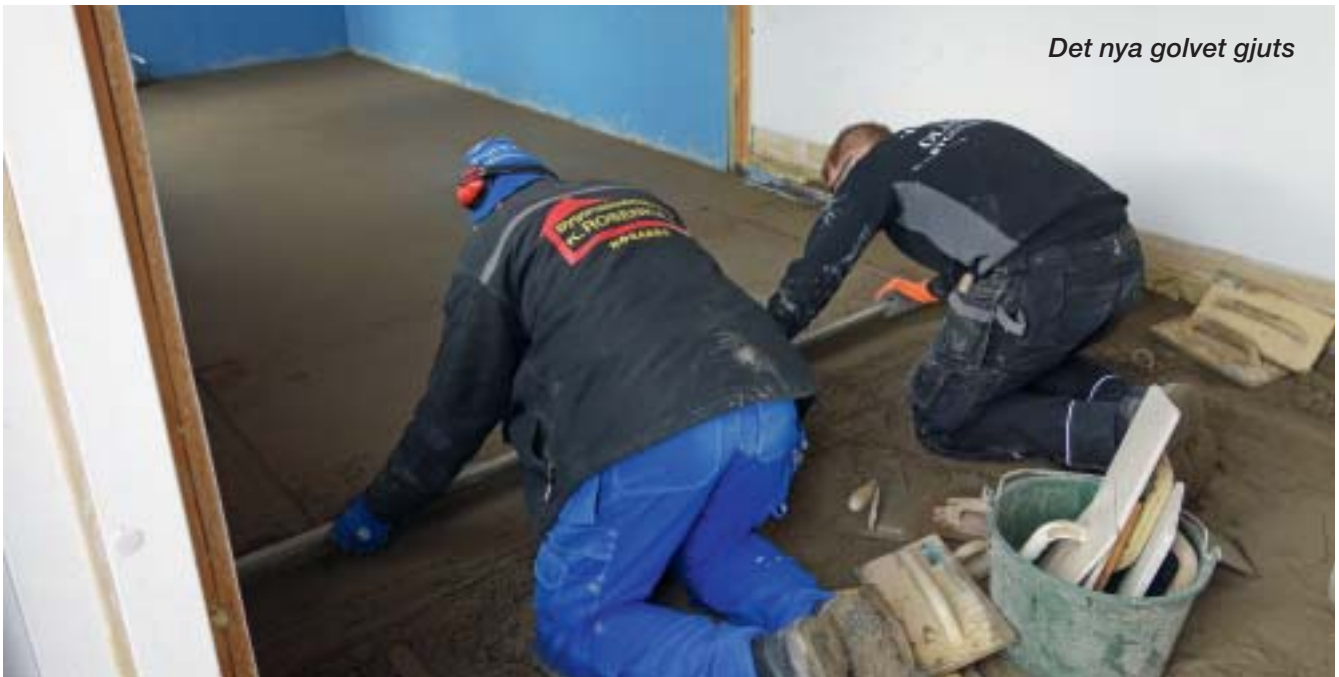
Det nya golvet gjuts

När Galleri Hoddan öppnar i år är det 20 år sedan den första utställningen ägde rum. Lagom till jubileet kommer Hoddan inte att vara sig riktigt likt. Den har nämligen byggts samman med hoddan nedanför. En mellanvägg har ri-