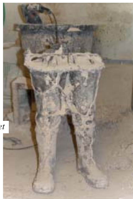
Benparet i brons