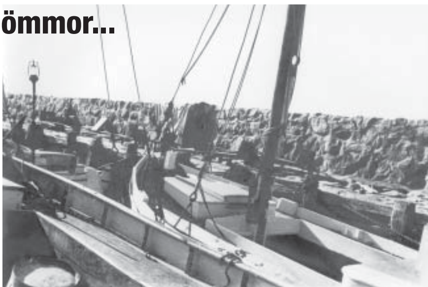
Fotot 'fiskebåtar vid hamnpir' är taget från båten 'Hasse'. Den främsta båten heter 'Sjöfågeln' och båten till höger är troligtvis 'Beckers'.

Hamnmuseet och aktiva medlemmar i museigruppen har under många år samlat in och tagit emot gamla föremål, foton och dokumentation. Allt material blir noggrant dokumenterat och arkiverat för att göra det enkelt för alla besökare att hitta det material som de är intresserade av. Det tar tid att få gamla foton och bilder skannade för att kunna arkivera dem digitalt. Museigruppen och andra i byn tyckte att det skulle kunna finnas sätt att visa bilderna mer aktivt