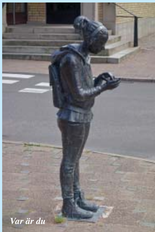
Var är du