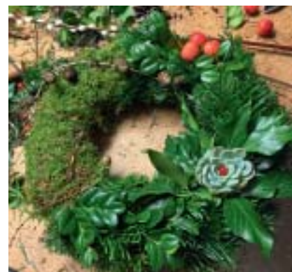
Lerberget i vinterskrud 2012