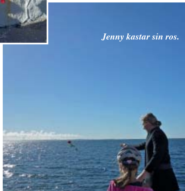
Jenny kastar sin ros.