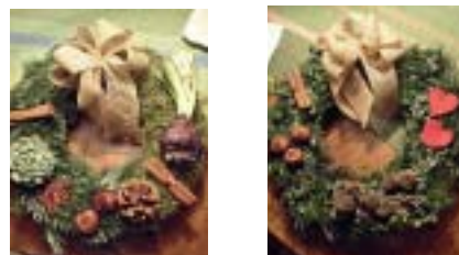
Kransbindning inför julen